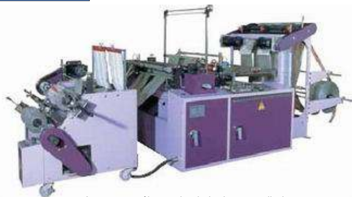
Automat z pół-r cznie obsługiwany zwijark .