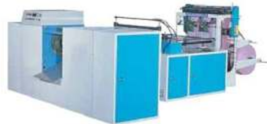
Automat z automatyczna zwijark (2 x 210 mm lub 1 x 400 mm)